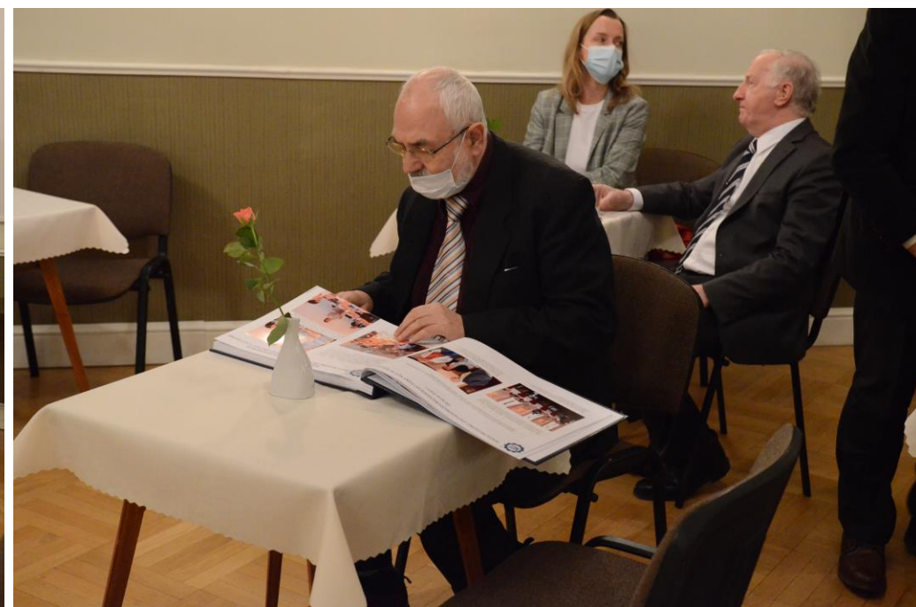
Podczas spotkania można było obejrzeć kronikę PZiTb za 2021 rok