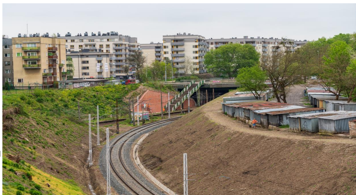
Linia kolejowa 406 widok na plac budowy na Pomorzanach