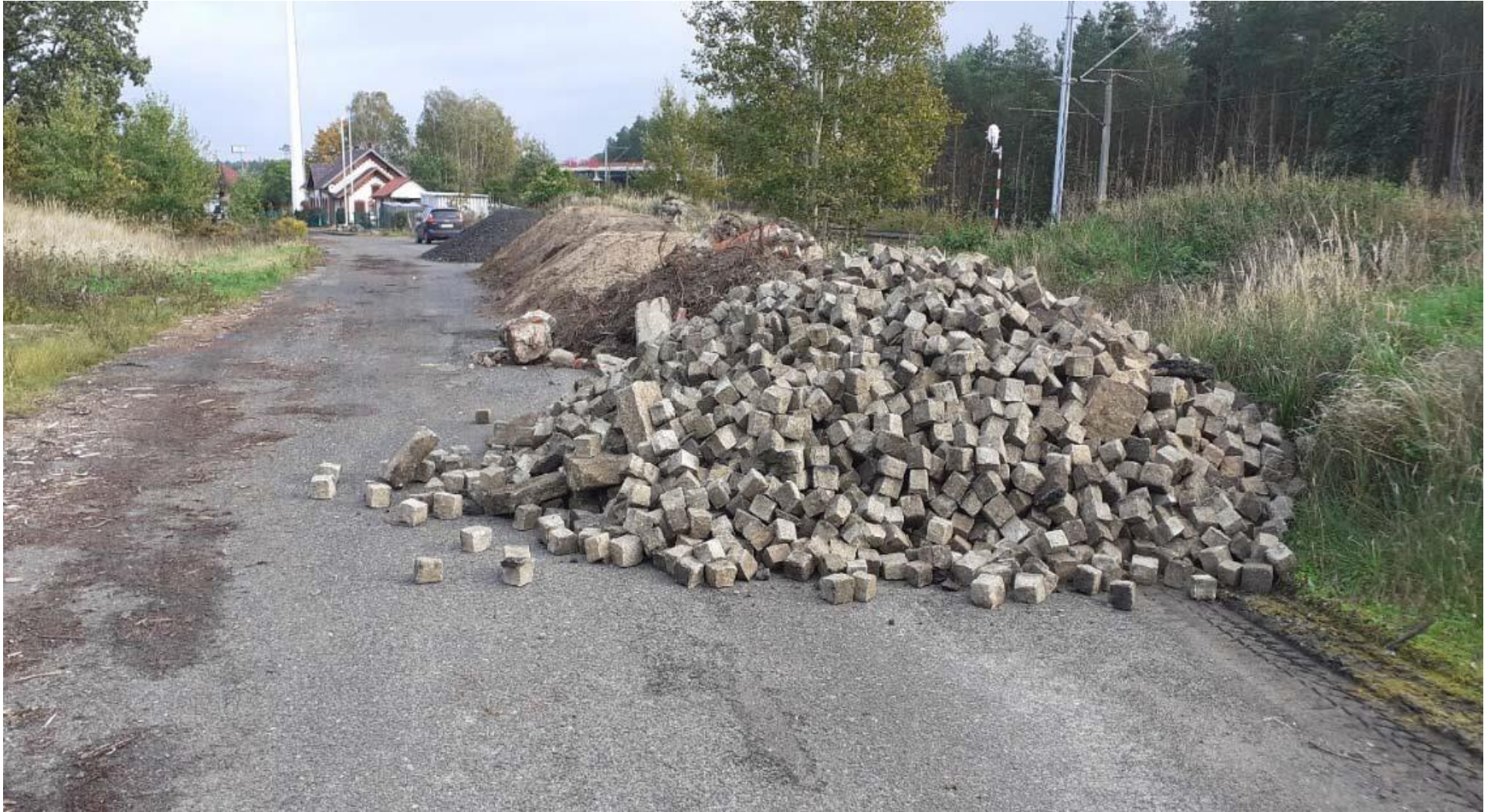
Budowa infrastruktury węzła przesiadkowego Goleniów Park Przemysłowy

Partner Gmina Goleniów zrealizowała umowę na projekt Wykonanie infrastruktury węzła przesiadkowego na stacji Kliniska. Obecnie zadanie jest przed podpisaniem umowy na roboty. Realizowane są też roboty na „Wykonanie infrastruktury węzła przesiadkowego na przystanku osobowym Goleniów Park Przemysłowy.”