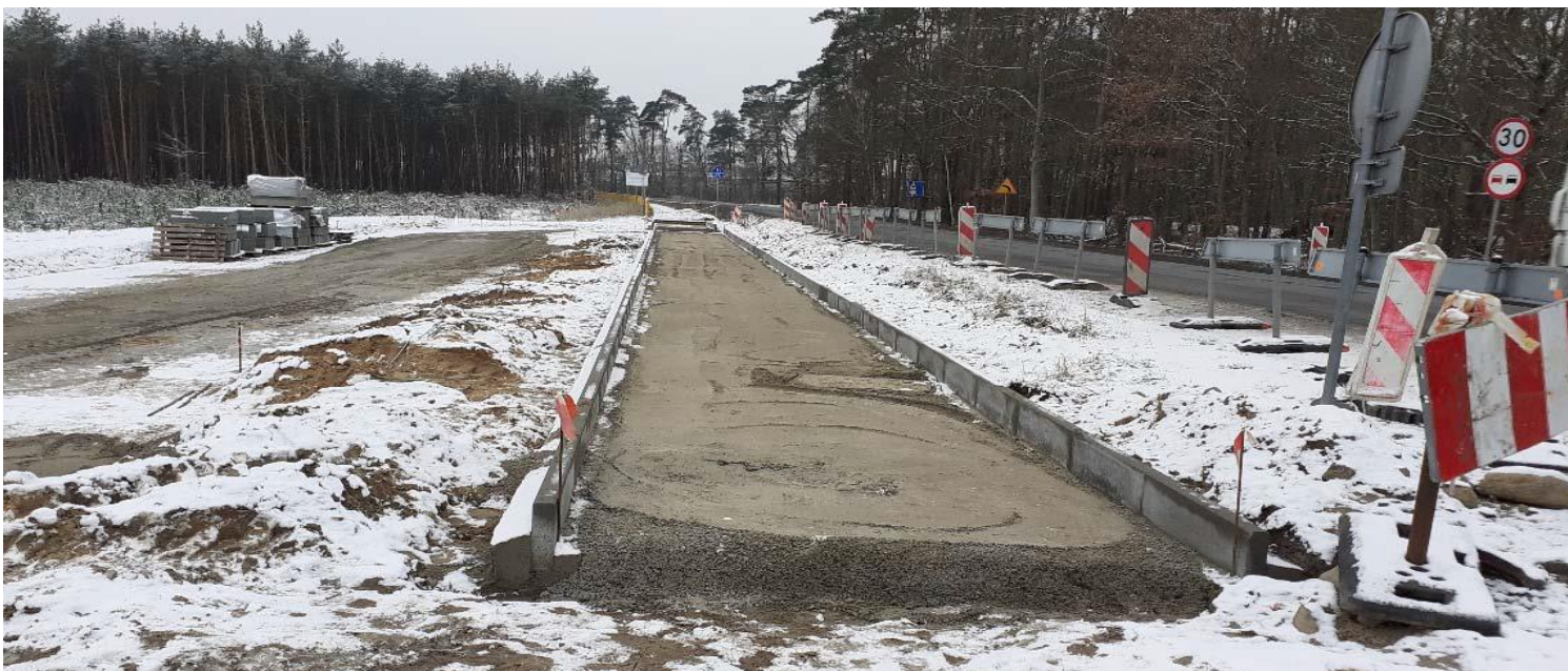
Przebudowa ścieżki rowerowej – XII.2021