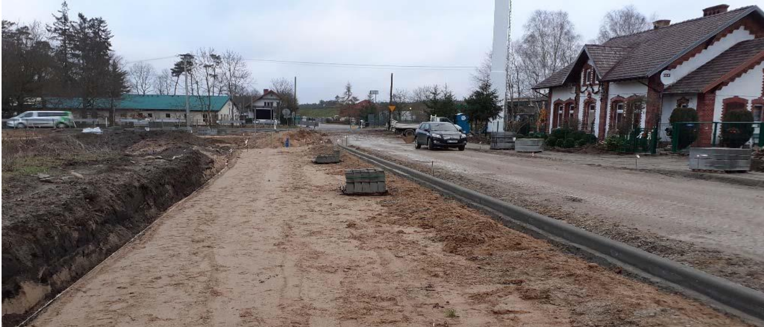
Koryto parkingu wraz z krawężnikiem – XII.2021